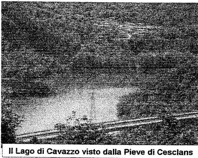
Il Lago di Cavazzo visto dalla Pieve di Cesclans