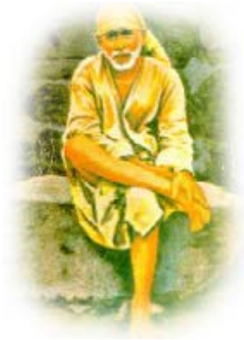
Shirdi Sai Baba

Non è necessario avere un guru ogni cosa è all'interno di noi.