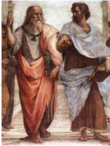
Platone e Aristotele

umano. Servirà Marshall McLuhan un filosofo morto negli anni 1970 per riuscire ad iniziare a pensare che noi abbiamo due emisferi del cervello ed abbiamo privilegiato quasi esclusivamente l'uso di un emisfero, quello sinistro, quello che presiede all'uso della mano destra, ma anche al linguaggio. Infatti la logica di cui parla la filosofia di Aristotele e buona parte della filosofia è logica linguistica, cioè le regole che mi autorizzano a dire certe cose e non altre sono le regole che presiedono alla lingua. Quindi quando io dico qualcosa di coerente, intimamente coerente rispetto al linguaggio che sto utilizzando OK sto dicendo il vero, se qualcosa si contraddice allora non sto più dicendo il vero, allora non è più legittimato a stare dentro la filosofia, McLuhan, ripeto, solo recentemente metterà il dito su questo aspetto, dirà, aspettate un attimo, c'è anche la metà destra del cervello, quella irrazionale, quella che funziona con altri schemi, ... e funziona! Il bello è questo, e tutti noi facciamo uso di