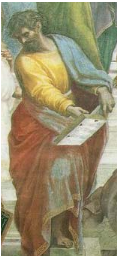
Parmenide raffigurato da Raffello Sanzio