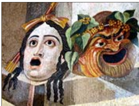
Le maschere teatrali raffiguranti la Tragedia e la Commedia

( http://www.utopie.it/formazione/psicodramma.htm )